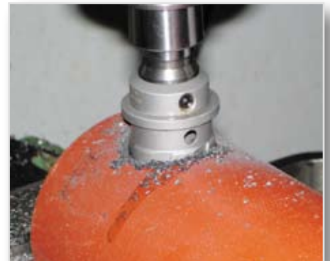
Borring i rör.