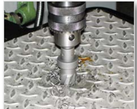
Borring i durkplåt.