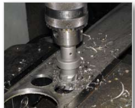
Borring i plattjärn.